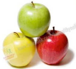
1. แอปเปิ้ล