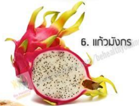
6. แก้วมังกร