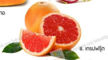
8. เกรปฟรุต