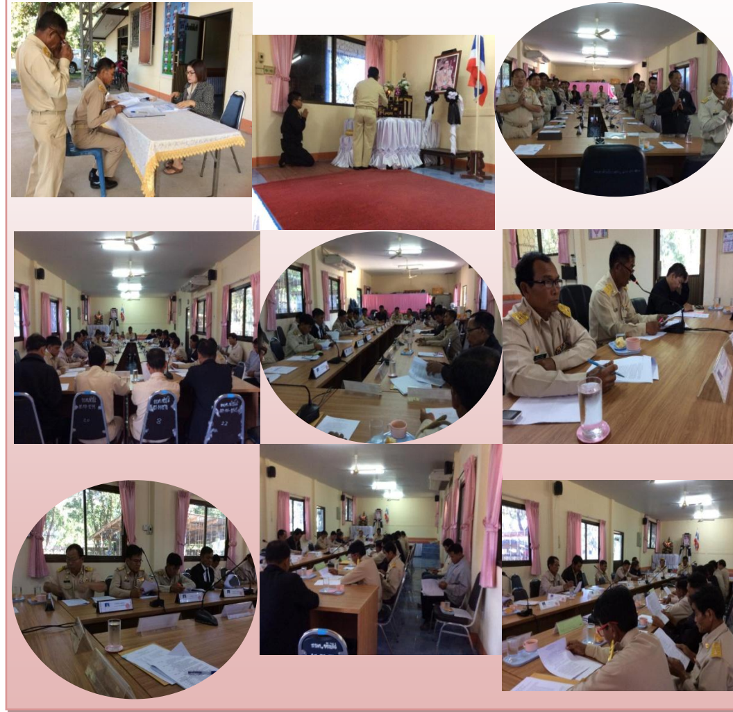
วาระการประชุมสามัญ ครั้งที่ ๔ ประจำปี พ.ศ. ๒๕๕๙

๑๕ ธันวาคม ๒๕๕๙ เวลา ๐๙.๐๐ น. สภา อบต. ห้วยไร่ ประกาศเรียกประชุมสภาสามัญสามัญสมัยที่ ๔ ประจำปี พ.ศ. ๒๕๕๙ ครั้งที่ ๑/๒๕๕๙ เพื่อรายงานผลรายรับ-รายจ่ายประจำปีงบประมาณ พ.ศ. ๒๕๕๙ ณ ห้องประชุมสภา อบต. ห้วยไร่ อ.เมือง จ. อำนาจเจริญ