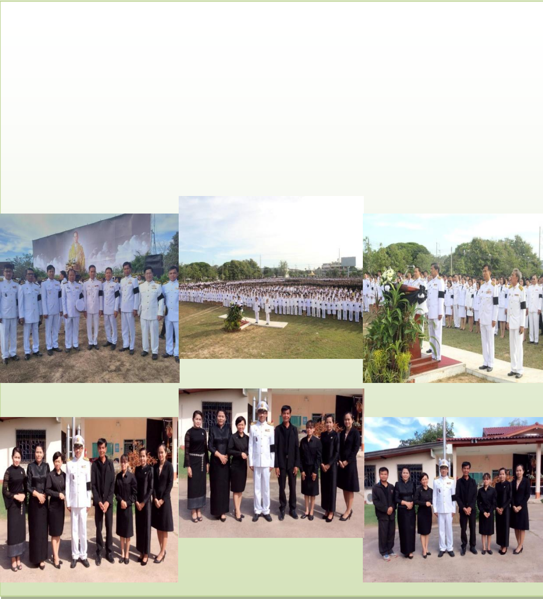
วาระการประชุมสามัญ ครั้งที่ ๓ ประจำปี พ.ศ. ๒๕๕๙