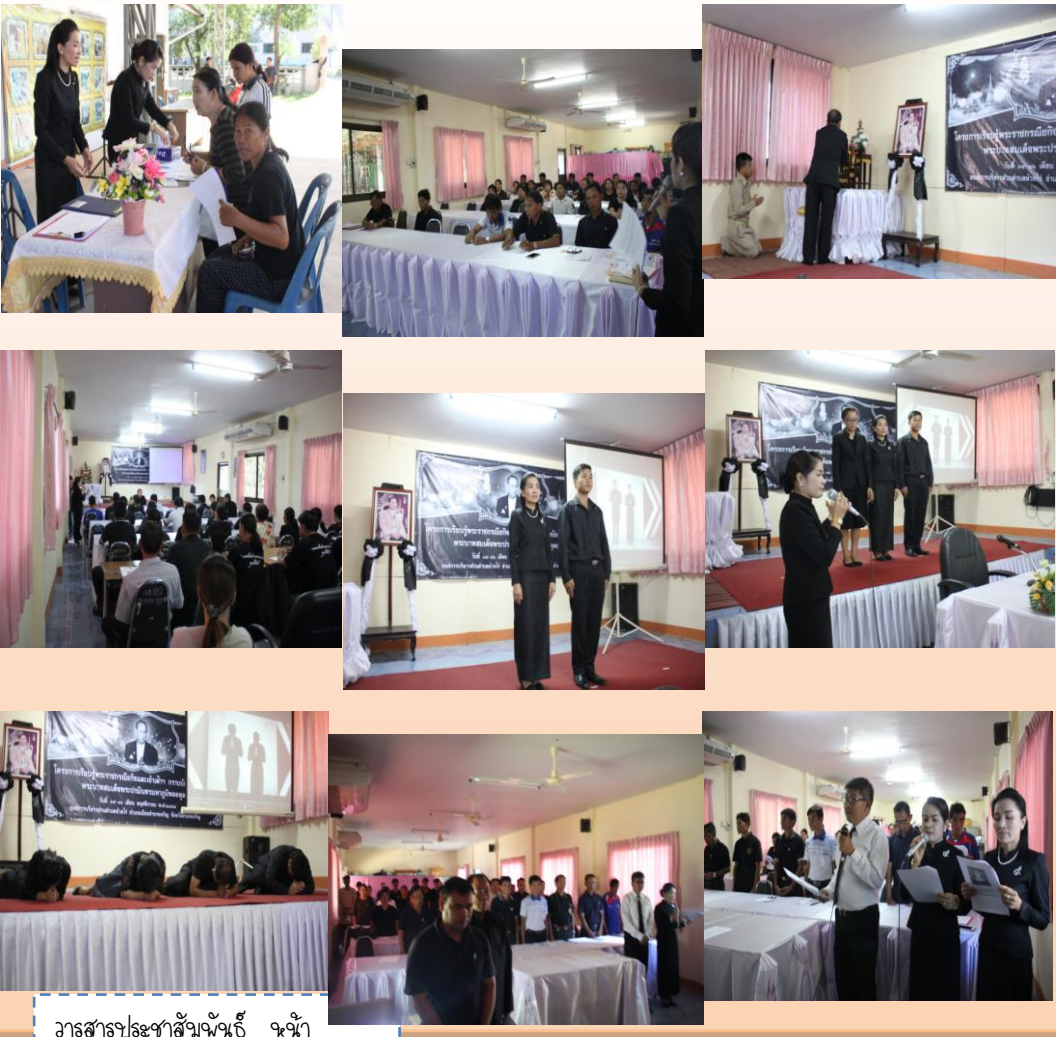
วารสารประชาสันพันธ์ จ.น้ำ