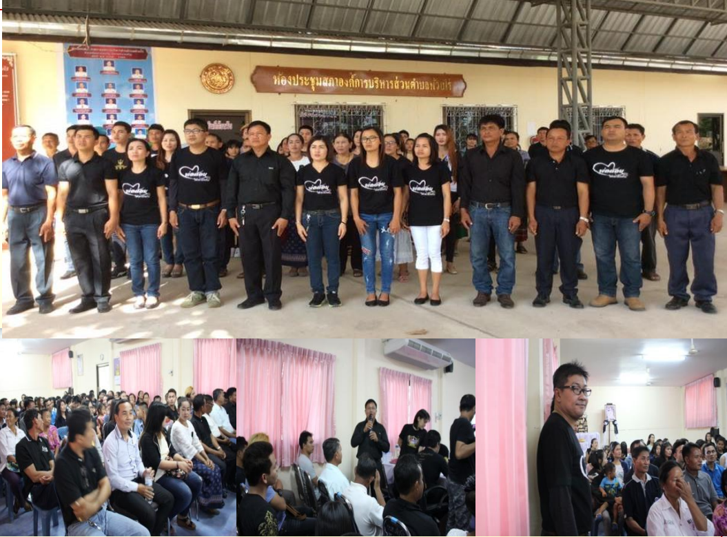
วาระสารประชาสัมพันธ์ ๑๑

เชิญร่วม แข่งขันประกวดร้องเพลง สมัครตัวต่อตัว