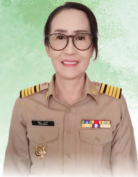
ผู้นำชุมชน

หมู่ที่ ๑ ตำบลโรงช้าง ในภาพรวมจะมีคณะกรรมการหมู่บ้านคอยรับฟังปัญหาของชาวบ้านเพื่อมาเสนอในที่ประชุม และเสนอแผนให้กับเทศบาลเพื่อไปพัฒนา จุดไหนของเราที่บกพร่อง เช่น ถนน รังน้ำ หรือสิ่งต่าง ๆ ที่มีปัญหา เราก็จะเสนอเทศบาล เพื่อของบประมาณมาให้เทศบาลดำเนินการให้ และการมีส่วนร่วมของประชาชน คือ มีโครงการอะไรเข้ามา เราจะถามจากชาวบ้านว่ามีโครงการอะไรเสนอมา แล้วก็เลือกโครงการที่น่าสนใจ ส่วนโครงการที่เหลือก็ไม่ได้ตัดออก เพราะเมื่อมีงบประมาณใหม่มา เราก็จะดึงโครงการเหล่านี้ขึ้นมาทำ เทศบาลเรามีปัญหาโครงการอะไรแจ้งกับทางเทศบาล เทศบาลจะเก็บแผนของเราไว้ ถ้ามีปัญหาหนัก ๆ ก็จะพูดคุยกับทางเทศบาล ให้ดึงแผนรีบด่วนขึ้นมาทำก่อน ได้รับการร่วมมือจากเทศบาลเป็น อย่างดี ให้ความร่วมมือดี