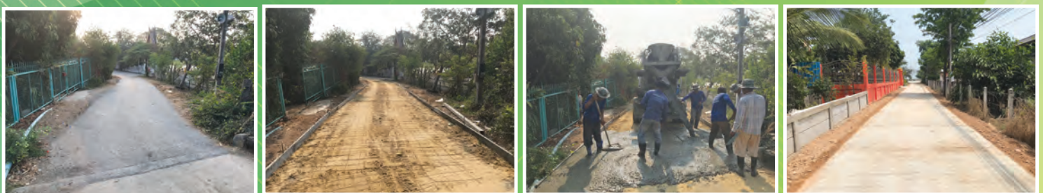
โครงการซ่อมแซมถนนเลียบริบคันคลองชลประทานจากปากท่อประตูระบายน้ำชลประทาน มาถึงบริเวณทางเข้า สภ.โรงช้าง หมู่ที่ ๑ ตำบลโรงช้าง