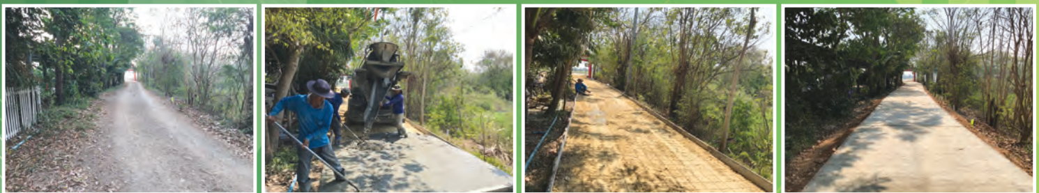
โครงการขยายผิวจราจร บริเวณหลังโรงเรียนวัดน้ำเต้าถึงคอสะพาน ฝั่งทางโรงเรียนวัดน้ำเต้า หมู่ที่ ๓ ตำบลน้ำเต้า