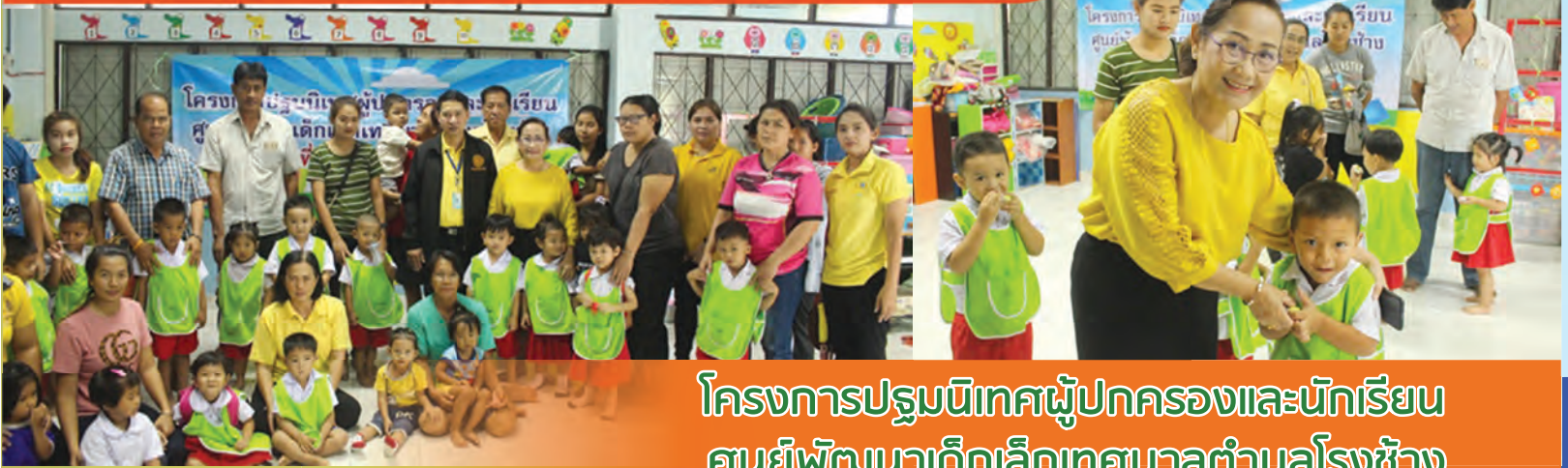
โครงการปฐมนิเทศผู้ปกครองและนักเรียน ศูนย์พัฒนาเด็กเล็กเทศบาลตำบลโรงช้าง