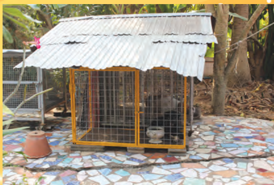
๒๕ รายงานกิจการเทศบาลตำบลวังช้าง ประจำปี ๒๕๖๒