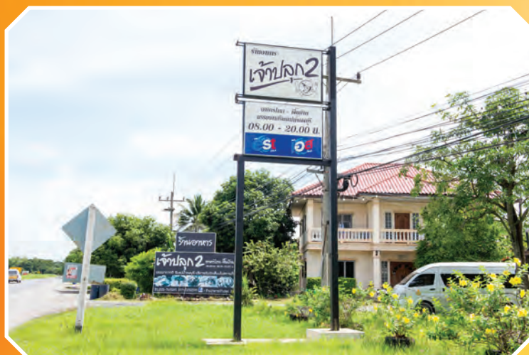
ร้านเจ้าปลุก ๒

เป็นร้านอาหาร ตั้งอยู่บริเวณสี่แยก ตำบลเจ้าปลุก อำเภอมหาราช จังหวัดพระนครศรีอยุธยา เป็นที่ตั้งของร้านอาหารจำนวนมากซึ่งในบริเวณนั้นมีประชาชนสัญจรผ่านไปมาต้องหยุดพักรับประทานอาหารบริเวณสี่แยกเจ้าปลุก ทำให้มีชื่อเสียงเป็นที่รู้จักของคนทั่วไป ทั้งต่างจังหวัดและในจังหวัดพระนครศรีอยุธยา อาหารที่ขึ้นชื่อได้แก่ ปลาช่อนเผาเจ้าปลุก ร้านอาหารสี่แยกเจ้าปลุก มีดังนี้