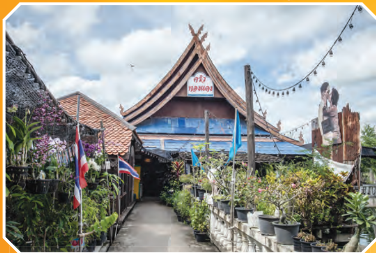
ร้านครัวทองแดง โทร ๐๓๕-๗๑๒๕๔๐