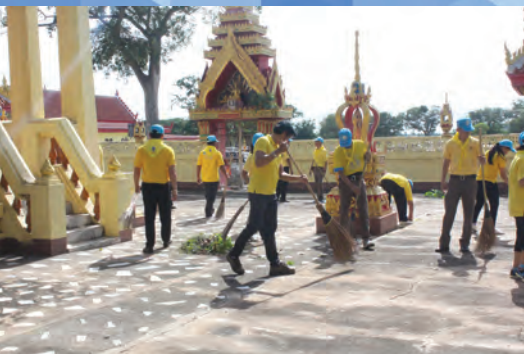
๒๙ รายงานกิจการเทศบาลตำบลวังยาง ประจำปี ๒๕๖๖