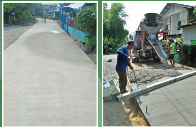
โครงการก่อสร้างถนน คสล. บริเวณกลุ่มบ้านนางแก้ว หมู่ที่ ๓ ตำบลน้ำเต้า