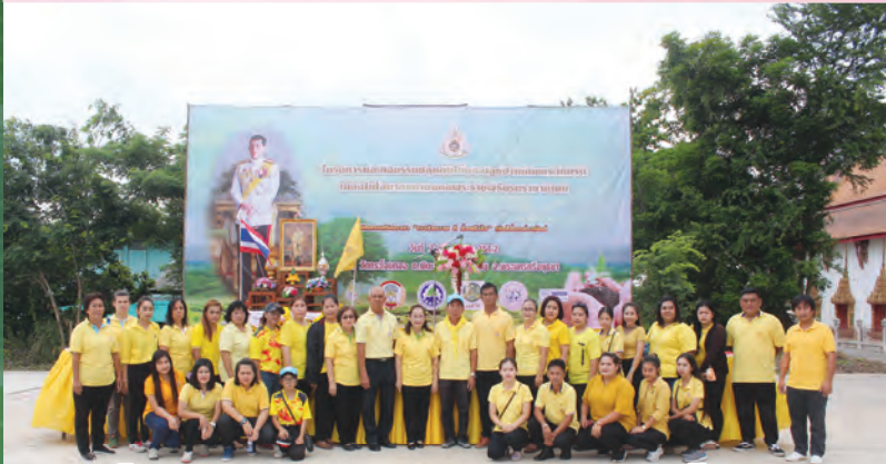
โครงการและกิจกรรมปลูกต้นไม้และปลูกป่าเฉลิมพระเกียรติ เนื่องในโอกาสมหามงคลพระราชพิธีบรมราชาภิเษก