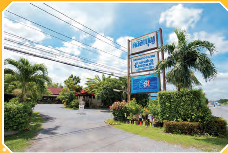
ร้านคลองบุญ (เจ้าปลุก ๓)