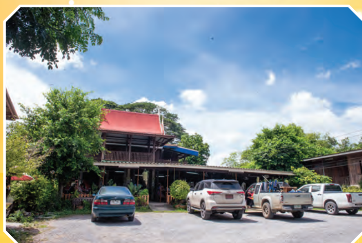
ร้านแยกเจ้าปลุก ๑